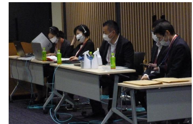
熱心な面談が行われます(上) 交流会の進行を担当しています(下)