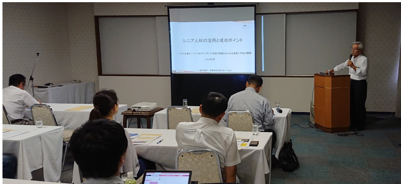
企業の皆さん、熱心に聞かれています

【実施事務局】株式会社YMFG ZONEプランニング(山口フィナンシャルグループ) 人材ニュース株式会社